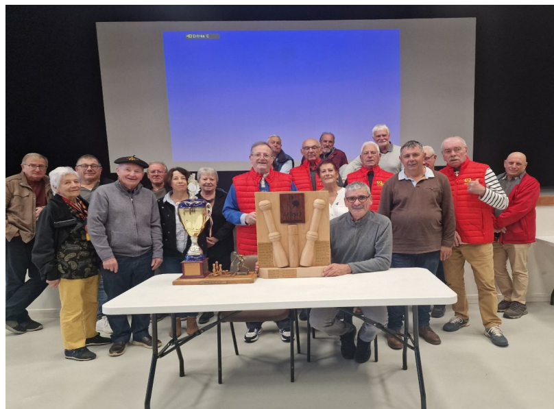
A.G. d'E.L.P.B. à Barcelonne du Gers du 08 Novembre 2025.