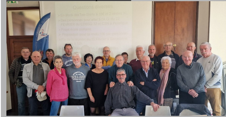
Le club a réuni ses licenciés pour 2025.

Le club E.L.P.B. est prêt pour cette nouvelle saison :